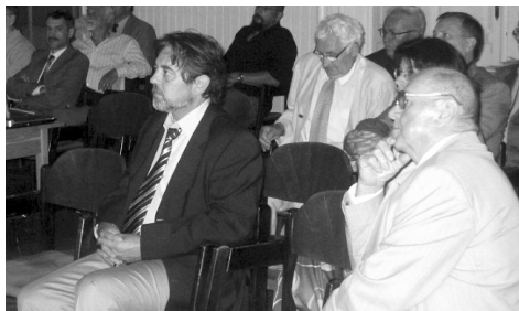
Előtérben a professzor unokája és fia