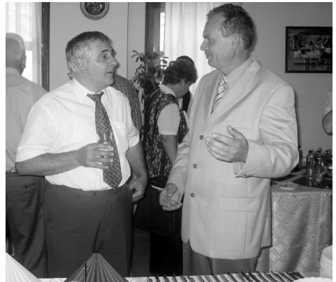
Részlet a fogadásról