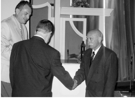
A kitüntetés átadása

nek állatorvos-szakmai kérdéseit vizsgálta a gyakorlatból vett konkrét esetek ismertetésével.