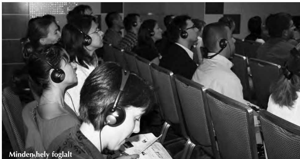
Minden hely foglalt

Este hét óra volt. Az előadásoknak vége, hátra volt még a tesztlapok kiosztása. Alig hittünk a szemünknek, hogy még vagy 140 kollégánk ült a teremben a tíz órás program végén is. Ha mi ólmos fáradtságot éreztünk, mit érezhetett az előadó? És hogyan állt fel a hallgatók zöme,