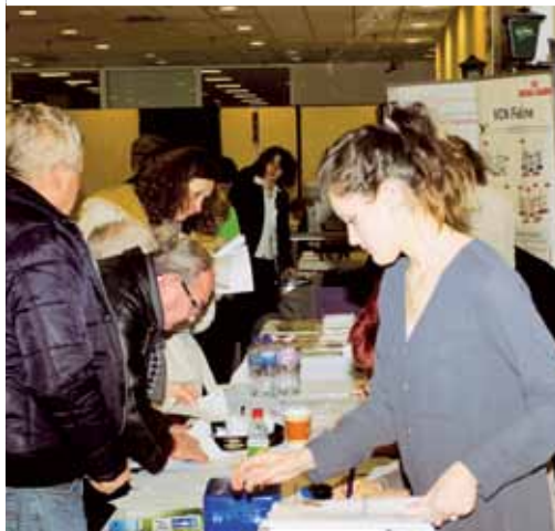
A szünetekben nagy volt a nyüzsgés