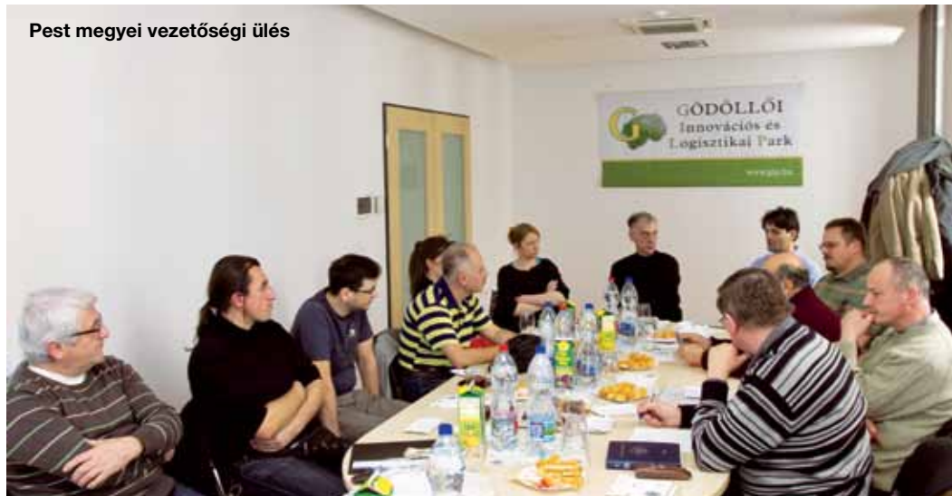
Pest megyei vezetőségi ülés

Az állatorvosi szolgáltatások szakmai színvonalának emelése érdekében az állat-