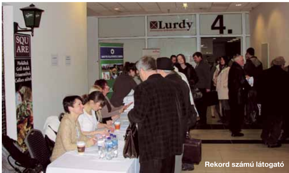
Rekord számú látogató

A Pest megyei szervezet TDK díjas előadása érdekes témát feszegetett: a közösségi