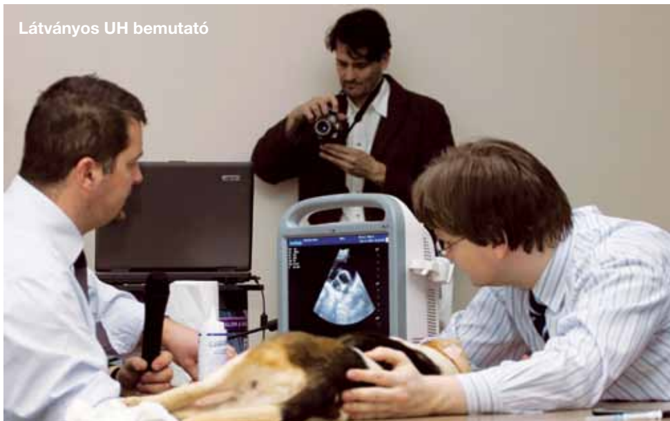
Látványos UH bemutató