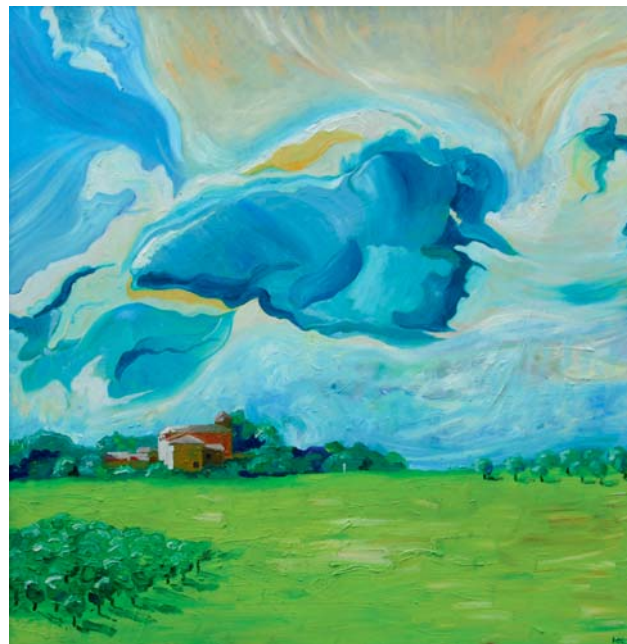
Illusztráció: Kerék Antal Toszkána festménye

Ha nem magunk diktáljuk a saját tempónkat, homok kerül a gépezetbe. Az évi négy megjelenés már tavaly is háromra